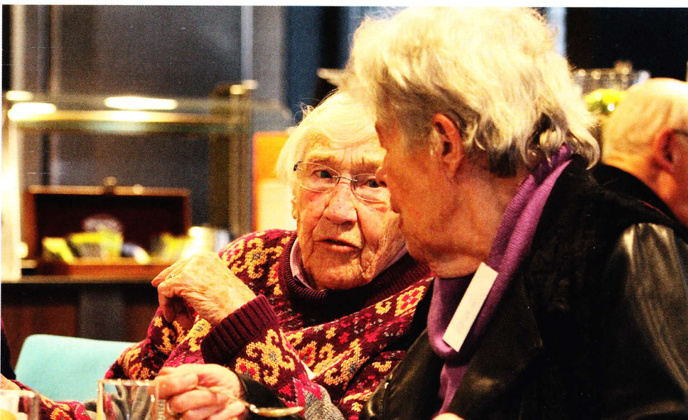
In Het Venster ontmoeten ouderen elkaar tijdens de contactochtenden.